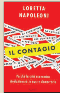
Il Contagio di Loretta Napoleoni